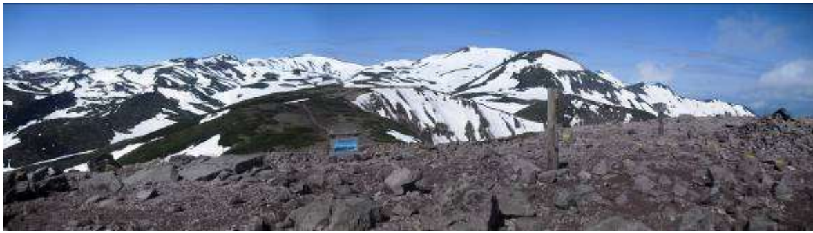
・6月7日 大雪の山々は風の強い稜線上以外はまだまだ雪の中です。今年は天候の影響で残雪が多いです。