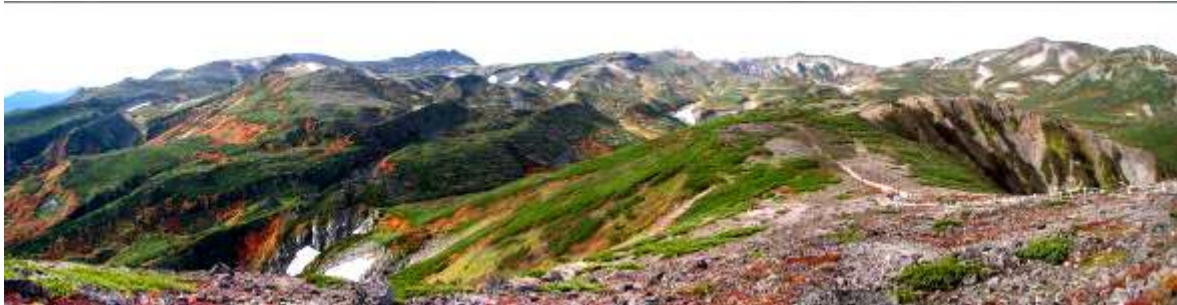
・9月20日 遅れていた紅葉も天候の影響で一気に深まり、結果的に昨年と同時期に見頃となりました。

☆ 全国自然いきものめぐりスタンプラリー ☆ 全国100ヶ所の国立公園・ビジターセンター等の館内の展示見学などをしてスタンプを集めて記念品をもらおう！ さらにそれぞれのビジターセンターで開催している「自然体験プログラム」に参加すると、ラリーにカウントできるシールがもらえます。ラリーシートは、全国のビジターセンターで配布中です。皆様の参加お待ちしております♪ 期間は2013年3月まで。