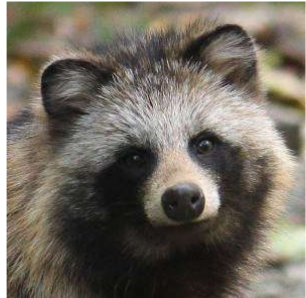
【地面に落ちている木の実を探していました】