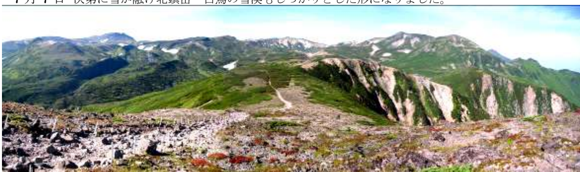
・8月29日 昨年と同様期に山頂周辺の「ウラシマツツジ」の紅葉が始まりました。