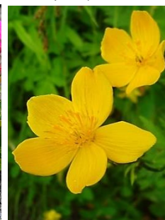
チシマノキンバイソウ