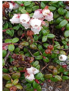
コメバツガザクラ