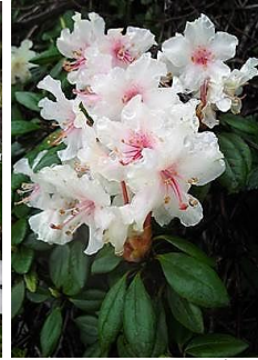
キバナシャクナゲ