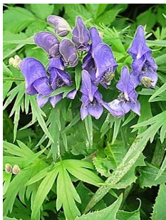
ダイセツトリカブト