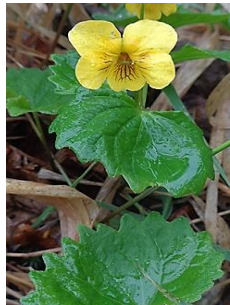
ジンヨウキスマレ