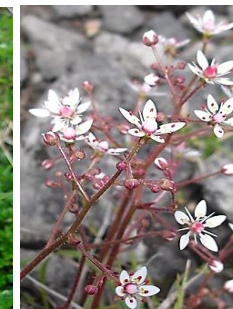
クモマユキノシタ

黒岳の登山道沿いには、およそ 100 種類の高山植物が見られます。今回は周辺も含めほんの一部のご紹介です。