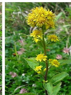
ミヤマアキノキリンソウ