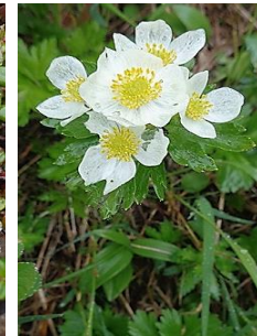
エゾノハクサンイチゲ