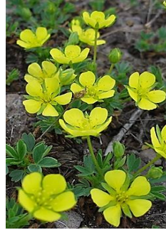
メアカンキンバイ