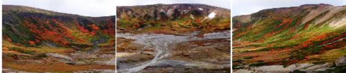
お鉢平: 火口付近は見頃を迎えています。深みのある赤いウラジロナナカマドが今年の特徴です。

【紅葉進捗状況】現在黒岳六合目まで色付き進む。北嶺岳に至るまで見頃期に入る。北海岳方面も見頃期。昨年比約一週間程度の早さ。平年比で見ても約二週間程度の早さで進行。「七合目ウラジロナナカマド」部分的に色付き始める。「八合目ウラジロナナカマド」見頃期も出始めてきた。「九合目～頂上ウラジロナナカマド」全体的に色付きが進むが、まねき岩周りはやや落ちてきた。沢筋は見頃。「石室～雲ノ平ウラジロナナカマド」石室周辺ではやや枯れかけも他は見頃期。