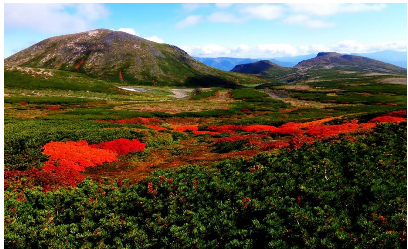
写真：雲ノ平周辺（上）・石室周辺（左下）・お鉢平周辺（右下）

《2014年の紅葉 黒岳周辺 9月》 例年より早く8月の中旬から気温が下がり始め、黒岳石室では早朝0℃となる日も出始めた2014年8月。寒暖の差が激しくなったこと等で、今年の紅葉は、昨年比約一週間・平年比約二週間もの早さで見頃を迎えました。紅葉が綺麗になる条件が重なったこともあり、黒岳を始めとした表大雪周辺では特にウラジロナナカマドが深みのある濃い色となりました。2003年度も同様の気象条件であったことで、今年同様に綺麗な色付きでしたが、結果的には10年に一度という見事な紅葉となりました。