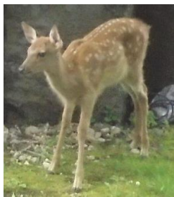
〔今年生まれたエゾシカ〕

6月下旬、雲ノ平でかわいく戯れる子ギツネたちに会いました。9～10月になると子ギツネも大きくなり、巣から離れます。