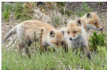
〔今年生まれたキタキツネ〕

6月下旬、雲ノ平でかわいく戯れる子ギツネたちに会いました。9～10月になると子ギツネも大きくなり、巣から離れます。