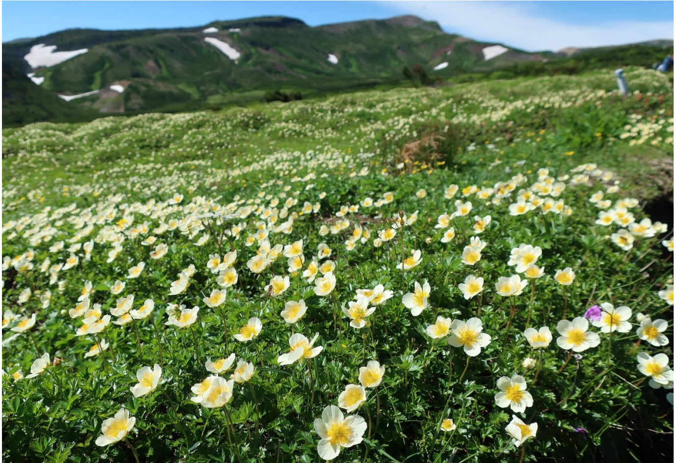
〔雲ノ平周辺のチングルマ群落・7月〕

大雪山をモチーフにしたポストカードでよく目にするチングルマの群落。大雪山では裾合平の大群落が有名ですが、雲ノ平のチングルマもなかなか見応えがあります。小ぶりの白い花が辺り一面に咲いているのを見ると、思わず感嘆の声を上げてしまうほどです。