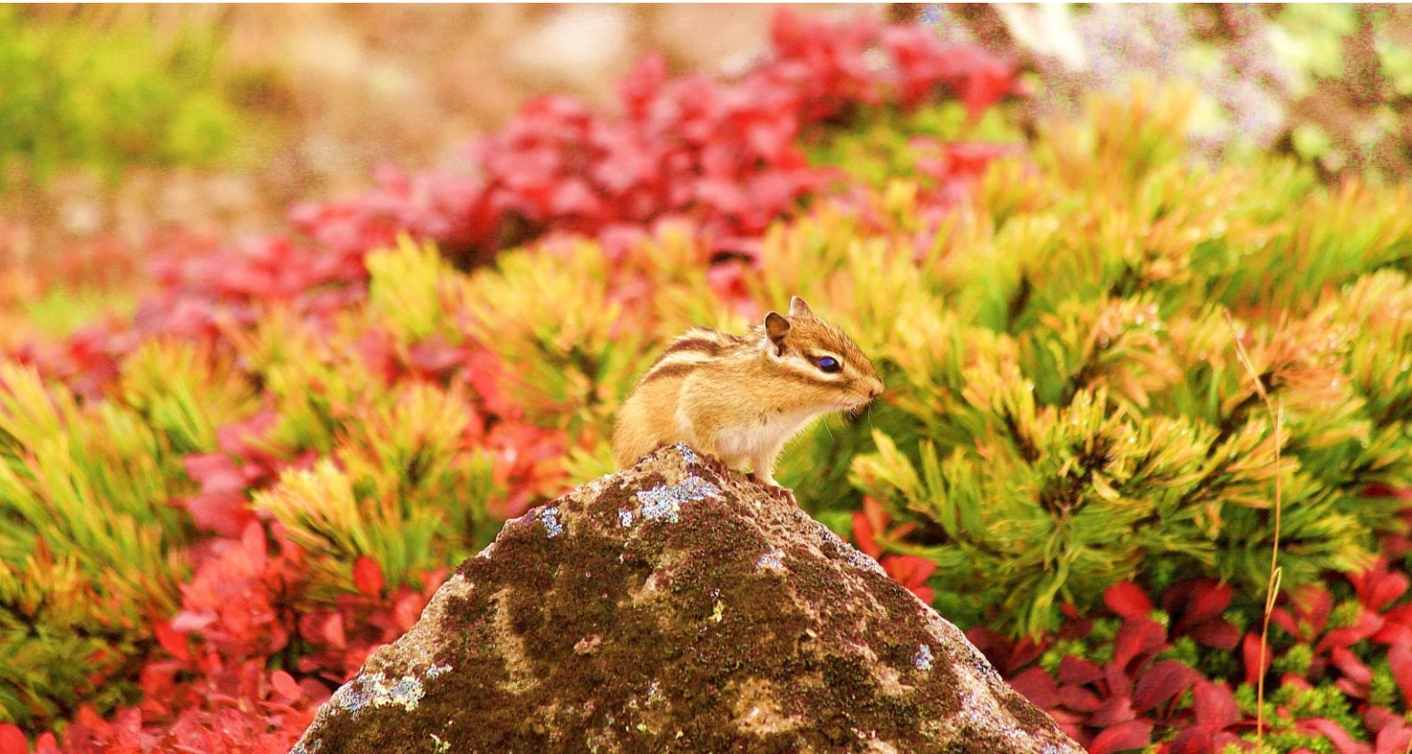
*大雪山系黒岳にて