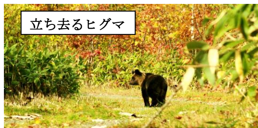
山ぶどうを見上げるヒグマ