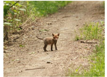
6月～仔ジカ 見つけた場合はそっと離れてネ 行く手を阻むキタキツネ・餌のおねだりです 勇気ある仔ギツネ・威嚇中