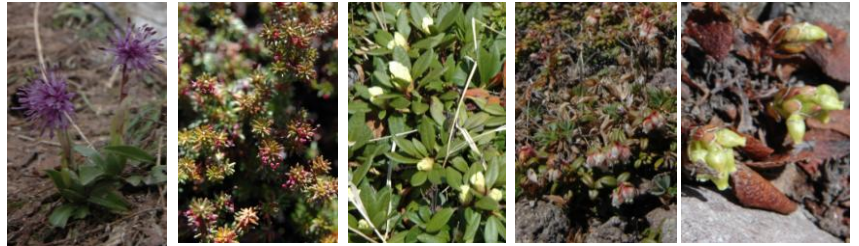
シヨウジョウバカマ ガンコウラン キバナシャクナゲ コメバツガザクラ ウラシマツツジ

【9合目】シヨウジョウバカマ↑【黒岳山頂直下】シヨウジョウバカマ↑【黒岳山頂】キバナシャクナゲ蕾、ウラシマツツジ↑、ミネズオウ蕾【ボン黒】ウラシマツツジ↑、コメバツガザクラ○、ミネズオウミネズオウ蕾、ガンコウラン○、キバナシャクナゲ蕾