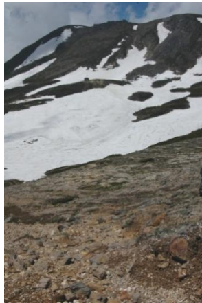
②分岐から見た板垣新道