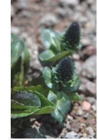
ホソバウルップソウ

【小泉平】ホソバウルップソウ蕾、タカネツメクサ↑、エゾオヤマノエンドウ↑、エゾコザクラ○、ミネズオウ○【白雲小屋】キバナシャクナゲ○、ミヤマキンバイ○、チシマアマナ○、エゾオヤマノエンドウ↑【北海平】ミネズオウ○、キバナシャクナゲ○