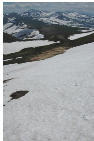
⑦白雲岳避難小屋～白雲分岐間