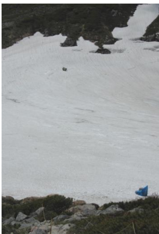
⑤白雲岳避難小屋テント場

①小泉平ではエゾオヤマノエンドウやエゾコザクラが咲いてきましたがホソバウルップソウは、まだ蕾です。②分岐下部から白雲岳避難小屋までは全面雪渓で登山道は見えません。③板垣新道にはロープが張られていますのでロープを目印にして歩くようにして下さい。④小泉平～白雲岳避難小屋周辺ではチシマアマナ、ミヤマキンバイ、エゾオヤマノエンドウ、キバナシャクナゲ、イワウメなどが咲き始め、なかでも小屋周りが一番多く開花していました。