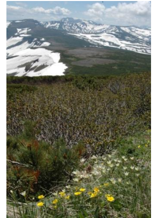
④白雲岳避難小屋前

①小泉平ではエゾオヤマノエンドウやエゾコザクラが咲いてきましたがホソバウルップソウは、まだ蕾です。②分岐下部から白雲岳避難小屋までは全面雪渓で登山道は見えません。③板垣新道にはロープが張られていますのでロープを目印にして歩くようにして下さい。④小泉平～白雲岳避難小屋周辺ではチシマアマナ、ミヤマキンバイ、エゾオヤマノエンドウ、キバナシャクナゲ、イワウメなどが咲き始め、なかでも小屋周りが一番多く開花していました。