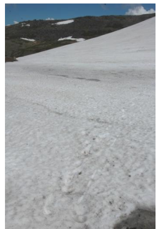
⑧北海平花の沢雪渓

⑤テント場周辺は全面雪で50～70cmの積雪がありました。⑥小屋の水場は管理人が掘り出している(積雪は170cm)ので水の確保はできます。⑦白雲岳避難小屋～白雲分岐までには2カ所(約60mと80m)の雪渓があります。⑧花の沢は全面雪(約260m)で登山道は全く出でおらず目印もないので霧やガスがかかる状況下では慎重な行動が必要です。