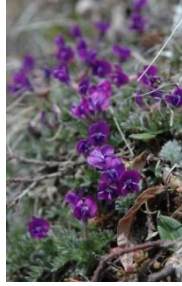
エゾオヤマノエンドウ