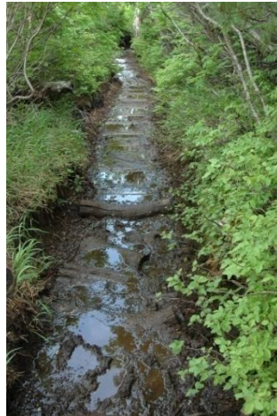
②第二花園までの登山道