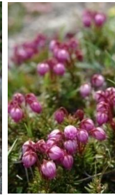
エゾノツガザクラ