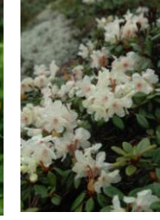
キバナシャクナゲ

【9合目】ウコンウツギ◎、ミヤマキンポウゲ◎、ハクサンチドリ◎、チシマノキンバイソウ○、カラマツソウ○、トカチフクロ↑【黒岳山頂～ポン黒】イワヒゲ○、コマクサ○、タカネスミレ○、エゾイソツツジ○、イワブクロ↑、エゾツツジ蕾【石室】エゾノツガザクラ◎、チングルマ◎、ミネズオウ○、エゾコザクラ↓