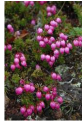
エゾノツガザクラ