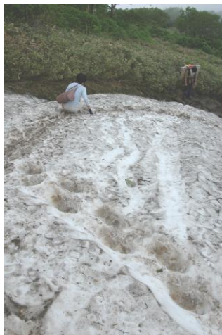
② 黒岳7合目標柱上部