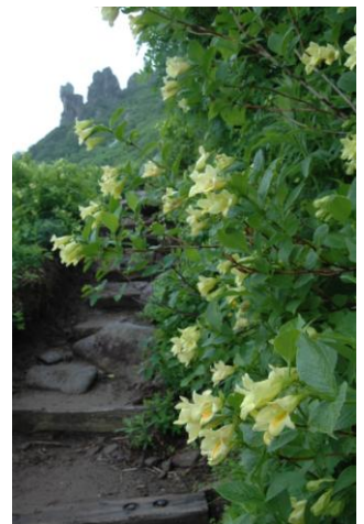
④黒岳9合目標柱付近

①黒岳7合目の雪渓は約9、21、4mが残る。②7合目標柱上部の21m雪渓は急斜面で固く、特に下山時は滑るので一般初心者には、かなり危険な状態。黒岳8合目周辺の雪渓は消失。③9合目標柱下周辺からチシマノキンバイソウ、ミヤマキンポウゲ、カラマツソウの花がほぼ満開となる。④9合目～山頂直下にかけてウコンウツギの花が見事になり、9合目周辺はそろそろ花の最盛期となる。