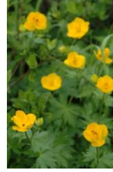
チシマノキンバイソウ