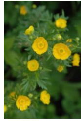
ミヤマキンポウゲ