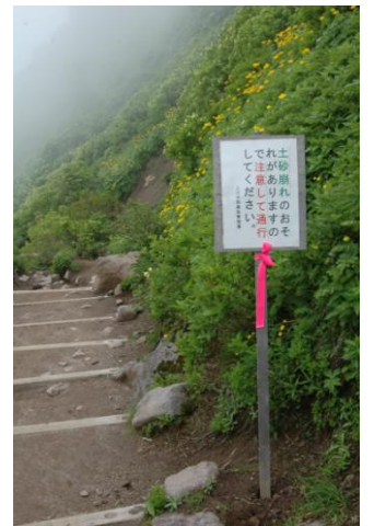
④9合目上部の崩壊地

①黒岳7合目～山頂にかけて唯一残っていた登山道上の雪渓（縁周りは多少残るが問題なし）も24日には消失。7合目周辺では登山道に流れ込んでいた雪解け水もほぼなくなり、道も乾いてきている。②8合目周辺のチシマノキンバイソウは全体的に花の傷みが目立つようになり開花後期となる。③9合目～山頂直下周辺のウコンウツギも全体的に花の傷みが目立つようになる。④長雨の影響で9合目上部の斜面では小規模な土砂崩れとなる。周辺ではダイセツトリカブトが開花してきた。