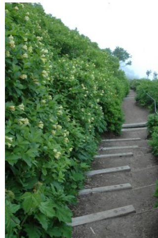
③黒岳9合目標柱周辺