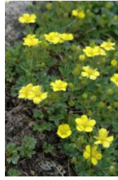
メアカンキンバイ