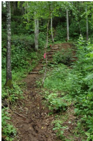
③登山入口すぐの階段

①以前の登山道は右側にある登山届け箱裏側から入林したが、上流部の丸太橋が折れて破損した為、登山口左側に新たな登山道が敷かれた。②登山道には笹刈り跡がまだ残り、歩きづらく転倒時はかなり危険なので注意が必要。