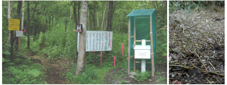
①新設登山道(左)と旧登山道(右)