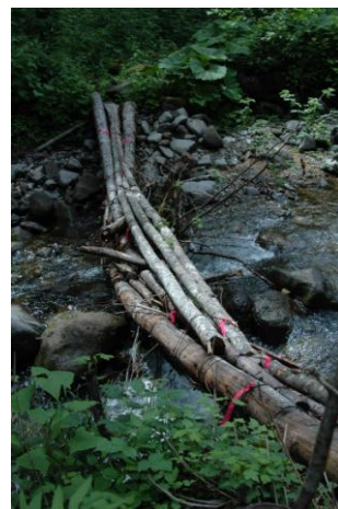
⑨旧道上流の折れた丸太橋