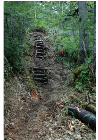
⑥ニシキ沢周辺の階段斜面

③登山口すぐから丸太階段があり、そこから上がり斜面平坦部を歩く。④平坦部の一部は元々作業道として使われていたので歩きやすい場所もある。⑤新たに笹刈りされた道は、笹の根元が10cm程刈り残されているので足元には注意が必要。⑥新たな登山道は登山入口~ニシキ沢まで1km前後と長くはないが、以前の道と比較すると多少は歩きづらいが大きな負担ではない。