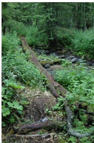
⑦ニシキ沢に架かる丸太橋

③登山口すぐから丸太階段があり、そこから上がり斜面平坦部を歩く。④平坦部の一部は元々作業道として使われていたので歩きやすい場所もある。⑤新たに笹刈りされた道は、笹の根元が10cm程刈り残されているので足元には注意が必要。⑥新たな登山道は登山入口~ニシキ沢まで1km前後と長くはないが、以前の道と比較すると多少は歩きづらいが大きな負担ではない。