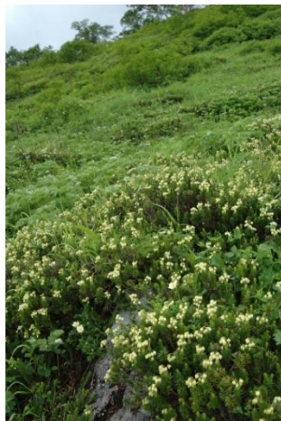
② 第一花園看板周辺