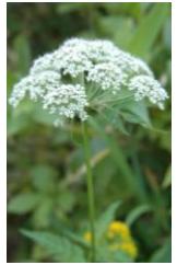
ミヤマセンキュウ