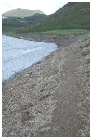
⑤北海沢ベンチ周辺