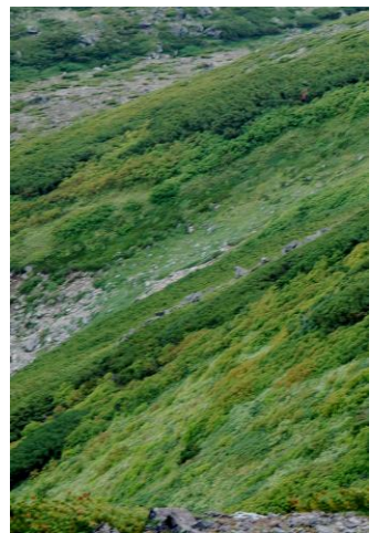
③赤石川沿いの斜面

①黒岳8～9合目登山道沿いではダイセツトリカブト、コガネギクなどの残り花が咲いていた。9合目～山頂直下ではハイオトギリの草紅葉が全体的に色づいてきた。②黒岳山頂周辺のナナカマド紅葉は色づき始めていたが、全体的にはまだ緑色の葉が多く遠目からではよくわからない程度。③黒岳周辺では赤石川沿い斜面のウラジロナナカマドが、最も色づいていたがまだ1割程度の紅葉。26日午後14:00の黒岳山頂の気温11度。石室周辺の最低気温は0度近くまで下がり、初氷を確認。