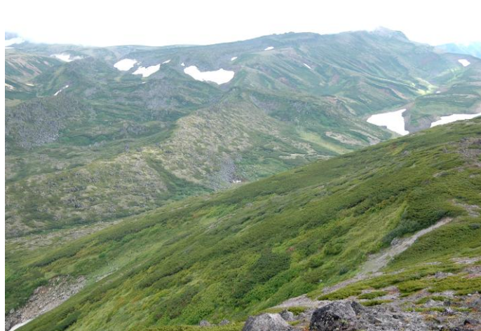
②黒岳山頂から見た北海岳方面