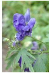
ダイセツトリカブト