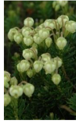
アオノツガザクラ