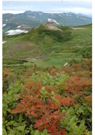
⑧白雲岳避難小屋周辺

⑤第3雪渓下部のナナカマドは全体的にうっすらと色づく程度。⑥第3雪渓上部のナナカマド紅葉は雪渓沿いが随分と色づいてきている。雪解け間もない所ではチングルマ、ジムカデ、エゾノツガザクラなどが咲いていた。⑦第4雪渓上部のナナカマド紅葉は3割ほどが色づき、登山道沿いではウサギギク、ヨツバシオガマが咲いていた。赤岳山頂周辺のウラシマツツジは7～8割ほどが色づいていた。⑧白雲岳避難小屋周辺のナナカマド紅葉は2割ほどが色づく。 *小屋周辺にはヒグマが徘徊しているので注意!