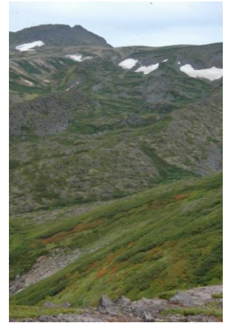
④赤石川沿いの斜面

①黒岳8合目登山道沿いではウラジロナナカマドがうっすらと色づく。②黒岳9合目標柱周辺のナナカマドも一部色づくが、全体的な広がりはまだない。③マネキ岩周辺ではハイオトギリ、ウコンウツギ、ウラジロナナカマドなどの色づきが濃くなる。④黒岳山頂周辺のウラジロナナカマドは色づいてきたが、北海岳方面のナナカマド紅葉は黒岳周辺ほど色づいていない。