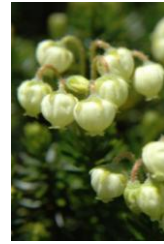
アオノツガザクラ