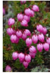
エゾノツガザクラ