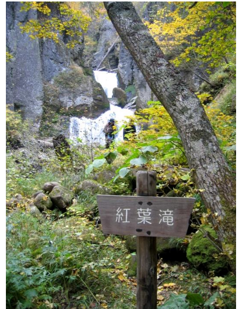
紅葉滝：水量が多く豪快です