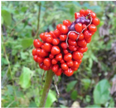
コウライテンナンショウの実