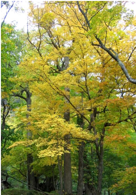
甘い香りを発するカツラ