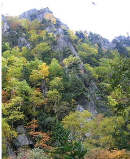
柱状節理を彩る紅葉