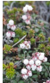
コメバツガザクラ