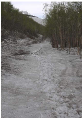
①銀泉台事務所付近