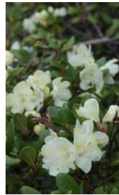
キバナシャクナゲ