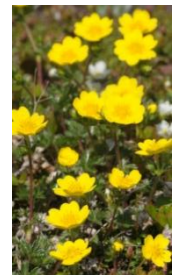
キバナシャクナゲ