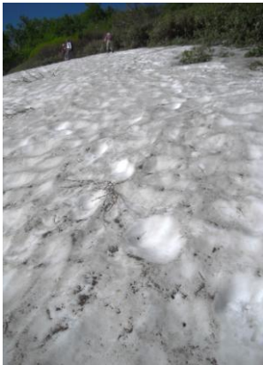
① 黒岳七合目～八合目へ

【七合】ショウジョウマカマ↑【八合】ショウジョウバカマ↑ウコンウツギ↑【九合周辺】エゾイワハタザオ○ミヤマキンボウゲ○エゾノハクサンイチゲ○ジショウキスミレ○ミヤマハタザオ○キバナノコマノツメ○ウコンウツギ↑ハクサンチドリ○チシマノキンバイソウ↑クロユリ○【頂上周辺】コマクサ○メアカンキンバイ○ミヤマタネツケバナ○エゾイワツメクサ○【ボン黒】ヒメイソツツジ○メアカンキンバイ○エゾツガザクラ○【石室周辺】エゾゴザクラ↑キバナシヤクナゲ○ミヤマキンバイ○エゾツガザクラ○チングルマ○【雲の平】イワヒゲ○コマクサ↑エゾツガザクラ↑チングルマ↑キバナシヤクナゲ○ミヤマキンバイ○メアカンキンバイ○チシマツガザクラ↑ヒメイソツツジ○エゾゴザクラ↑等