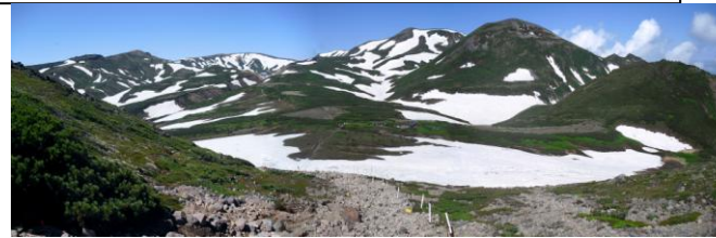
⑧ ボン黒岳より(上) お鉢平展望台周辺より(下)(中央黒岳)

⑤赤石川周辺は一面雪の状態です。視界不良時要注意です。⑥天候不良時は増水の可能性があります。また、対岸は約 1mの高さの雪壁があります。北海岳側から向かう場合は要注意です。⑦まだまだ分厚い雪渓が 200m弱あります。天候不良時は雪面が凍りつきます。また、濃霧時は迷いやすいです。特に、下りには要注意です。⑧まだまだ多くの残雪です。(上)⑧雲の平ー石室からお鉢平展望台手前までは消雪しています。