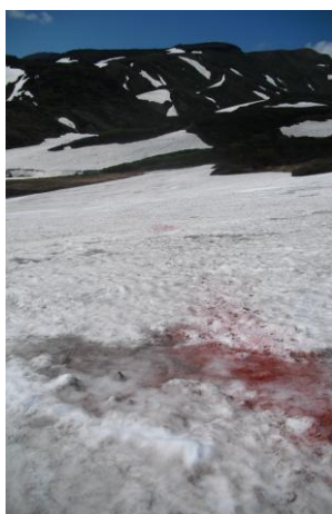
⑤ 石室から赤石川へ

①登山道も少しずつ露出してきていますが、この区間はまだ全面雪と言っても良いくらい。雪渓は分断されて、登り始め 10m、七合標柱を挟んで 45m、22m、6m、11m、17m、八合標柱を挟んで、22m、38mの雪渓。滑落の危険は弱りましたが、踏み抜きに注意。②そろそろ登山道のお花も賑やかになってきました。③全体的にはこれからといった感じですが、場所によっては見頃の所もあります。雲の平も同様です。④お鉢の手前、50mの雪渓有。