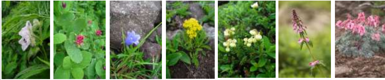
トカチフクロ チシマヒヨウタンボク イワギキョウ チシマキンレイカ アオノツガザクラ ヨツバシオガマ コマクサ

【七合】ミヤマキンポウゲ○【八合】ウコンウツギ○ミヤマキンポウゲ○【九合周辺】ミヤマキンポウゲ○キバナノコマノツメ○ウコンウツギ○ハクサンチドリ○チシマノキンバイソウ↑クロユリ○カラマツソウ○トカチフクロ○エゾヒメクワガタ○ハクサンボウフウ○イワヒゲ○【頂上周辺】コマクサ○メアカンキンバイ○エゾイワツメクサ○イワギキョウ↑イワヒゲ○チシマキンレイカ○イワブクロ↑【ボン黒】エゾイソツツジ○チシマキンレイカ○コマクサ○ホソパイワペンケイ↑【石室周辺】エゾコザクラ○ミヤマキンバイ○エゾツガザクラ○チングルマ○アオノツガザクラ↑ジムカデ○【雲の平】コマクサ○エゾツガザクラ○チングルマ○ミヤマキンバイ○エゾコザクラ○ヨツバシオガマ○ 等