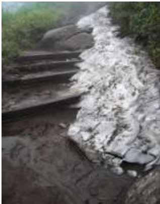
① 黒岳七合目～八合目へ