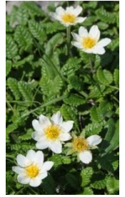
ヨツバシオガマ アオノツガザクラ イワブクロ イワヒゲ チョウノスケソウ