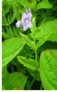
エゾヒメクワガタ