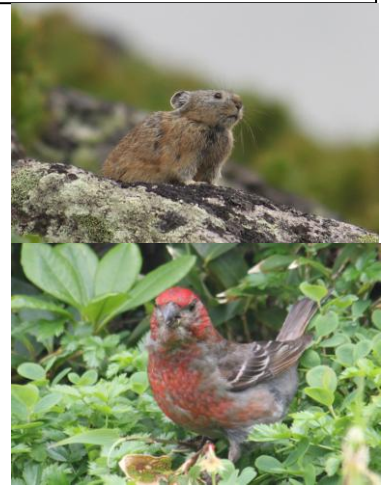
⑦ ナキウサギ・ギンザンマシコ

④雪解け場から「コエゾツガザクラ」等々が咲き始めています。⑤チシマツガザクラが見頃を迎えています。⑥「チングルマ」「エゾツガザクラ」等の群落は下降気味ですが、場所によっては見頃の所もあります。⑦この日の石室周辺では「ナキウサギ」や「ギンザンマシコ」が多く見られました。