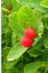
チシマヒョウタンボク