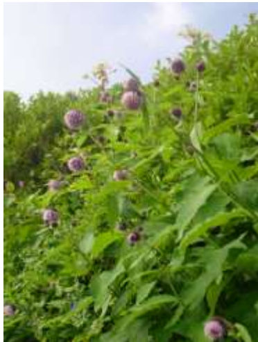
① 黒岳八合目～九合目

【七八合】モミジカラマツ、エゾウサギギク、ミヤマアキノキリンソウ、ヤマハハコ、ハイオトギリ、ウメバチソウ〇、チシマアザミ、ナガバキタアザミ、コモチミミコウモリ、ダイセツトリカブト〇、オオカサモチ、エゾニュウ、ミヤマセンキュウ、ミヤマホツツジ〇、イワギキョウ、チシマヒョウタンボク等【九合～頂上】ダイセツトリカブト、チシマアザミ、ナガバキタアザミ、ハイオトギリ、イワギキョウ、ヤマハハコ、ミヤマアキノキリンソウ、ウメバチソウ、タカネトウウチソウ、オニシモツケ、ミヤマセンキュウ、ミヤマホツツジ〇タカネスイバ(咲返)、チシマノキンバイソウ(咲返)等【頂上周辺～石室】イワギキョウ〇ミヤマリンドウ、ヨツバシオガマ、ミヤマアキノキリンソウ等々