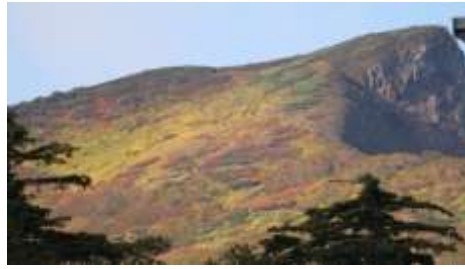
黒岳ペアリフト乗車中の黒岳