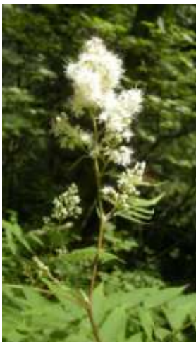
ホザキナナカマド