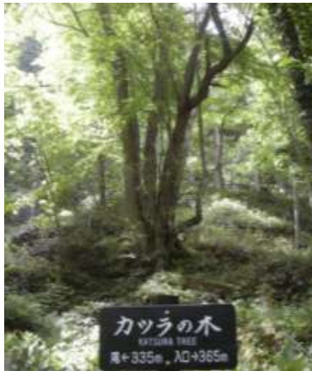
中間のカツラの木