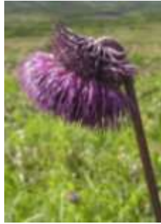
ミヤマサワアザミ