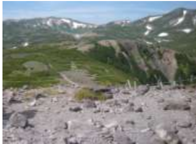
②黒岳山頂からの眺め