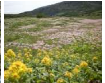
④ミヤマアキノキリンソウ

①黒岳斜面の植物は、そろそろ終わりに近づいてきましたが蜜を求めて昆虫たちが集まってきました。②黒岳山頂からの眺望。どの山の山頂にも登山者がいました。③ボン黒岳斜面のウラシマツツジが前回よりも色づき範囲が拡大してきました。④雲ノ平はチングルマの綿毛が一面に広がり、ミヤマアキノキリンソウ、ミヤマサワアザミ、ミヤマリンドウが咲いています。