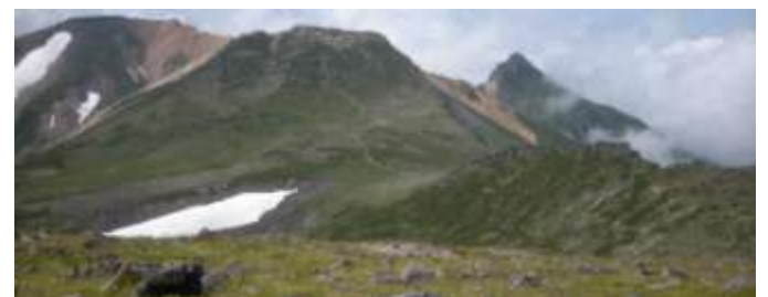
⑧北鎮岳からの眺め

⑤お鉢平展望台への登りは雪融けが遅かったのでアオノツガザクラ、エゾコザクラが咲いています。⑥硬い雪渓がすっかり消雪しました。⑦背景の山は旭岳。多くの登山者が集まり休む場所です。⑧左から安足間・比布・愛別岳。