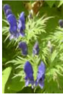
ダイセツトリカブト