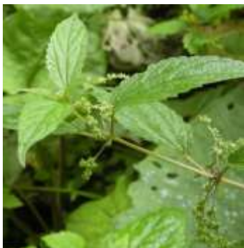
エゾイラクサ・・・トゲがあるので触れないこと!