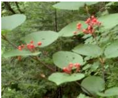
オオカメノキの実