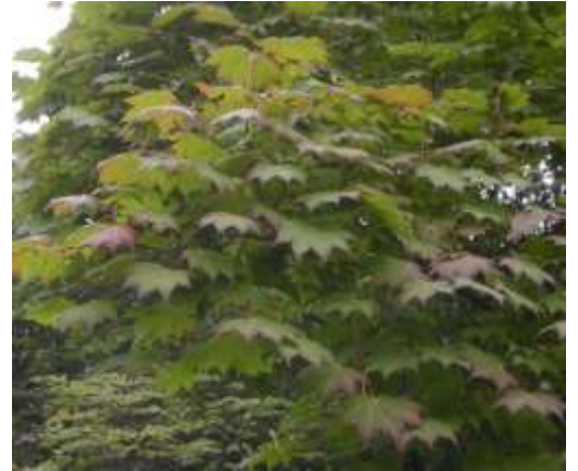
色が変わってきたハウチワカエデ