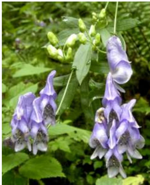
エゾトリカブト・・・毒草ですから触れないようにしましょう!