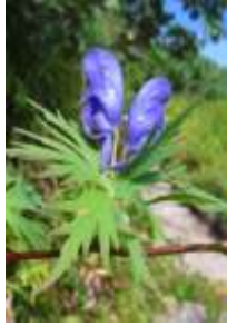
ダイセツトリカブト