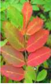
ウラジロナナカマド