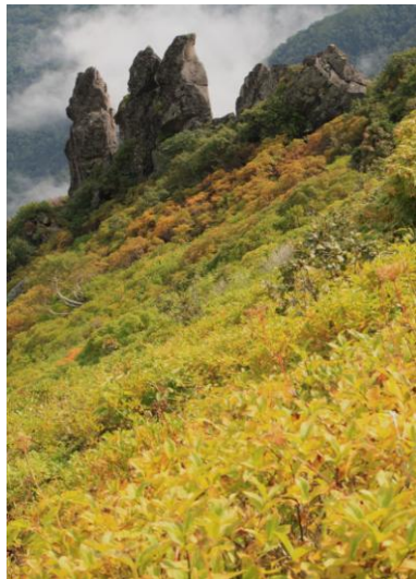
② 黒岳九合目まねき岩