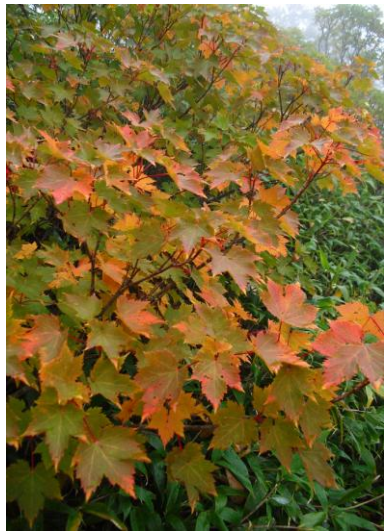
① 黒岳七～八合目周辺

【黒岳九合目周辺】全体的に「色付き」が始まりました。気温が高く推移していますので、「ゆっくりと」進行しています。【雲の平周辺】”部分的”ではありますが、「ウラジロナナカマド」の色付きが増えています。若干「枯れ気味」のものも目にしますが、来週から気温が下がる予報です。予報通りとなれば、見頃に近づく可能性が出てきました。平年よりは遅れていますが、ここにきて昨年並みに近づくこともありそうです。