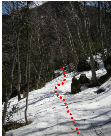
残雪が残る入口付近