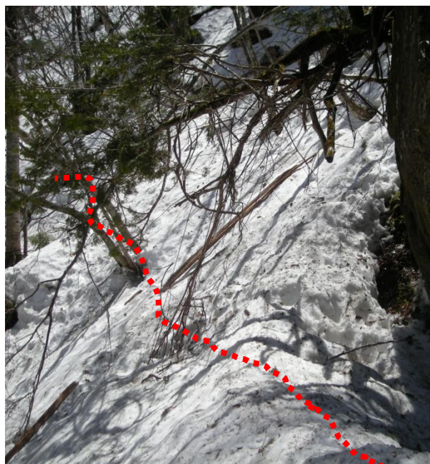
オンコ岩の先は最大の難所！