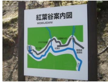
九十九橋にある看板