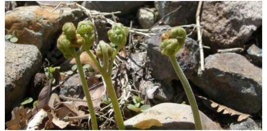
温泉の源泉地に出たワラビ