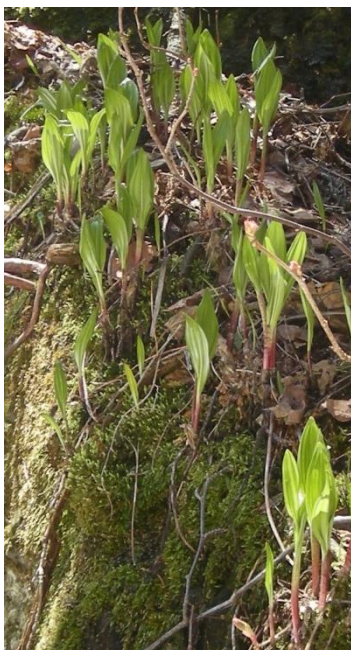
ギョウジャニンニク