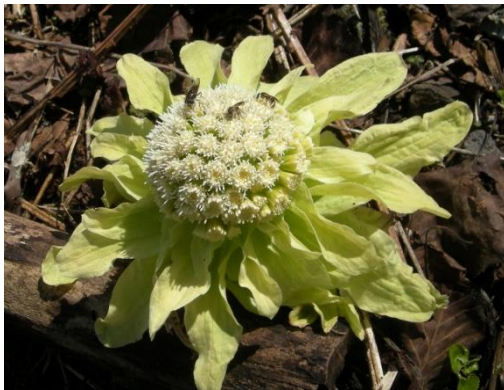
フキノトウにやってきた虫