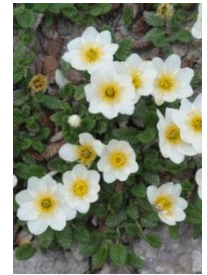
チョウノスケソウ

【コマクサ平】コマクサ○、イワブクロ↑、エゾツツジ↑、キバナシオガマ○ 【第4雪渓】キバナシクナゲ○、イワウメ○、チングルマ、ジンヨウキスミレ○ 【山頂～小泉平】ホソバウルップソウ↓、チョウノスケソウ○、メアカンキンバイ○