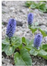
ホソバウルップソウ