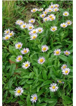
ミヤマアズマギク