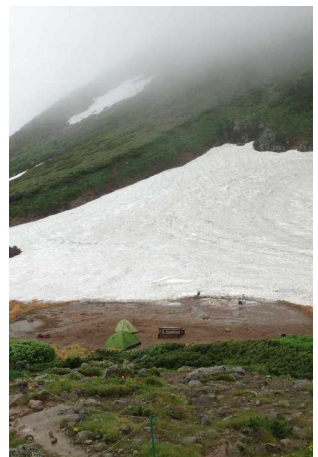
⑦白雲小屋野営指定地