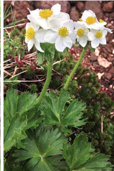
エゾノハクサンイチゲ