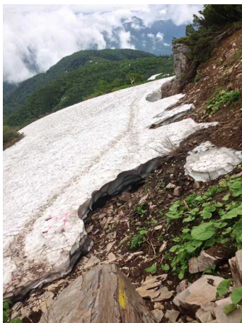
④エイコの沢ガレ場付近

登山口から下部樹林帯の雪はほぼ消失した。第一花畑からエイコの沢ガレ場まではほとんど雪原状態②。第一花畑上部のクラックは迂回しようとするヤブに拒まれてルートから外れるので、渡りやすい場所を通過する①。第二花畑上部で一部登山道が露出するが③、それ以外は雪原で、枝先に付けられたマーカー（ピンクテープ）を追っての歩行となる。マーカーの間隔が広いので見落としやすい。視界不良時は地形図・コンパス・GPSを使ってのルートファインディングになる。エイコの沢ガレ場のシュルンドは小さくなったが、急斜面のため滑落には注意が必要だ④。板垣新道底部は雪原⑥、白雲小屋のテントサイトは、ほぼ露出した⑦。