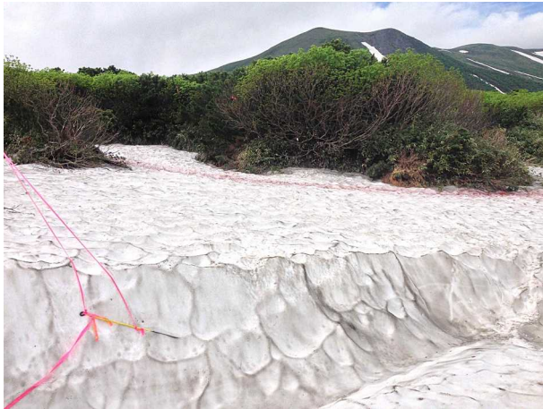
①第一花畑上部のクラック