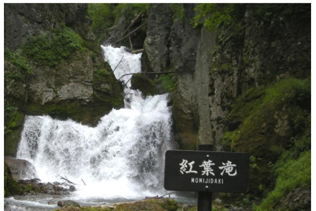
紅葉滝: 冷たい水の飛沫に包まれています