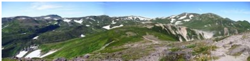
黒岳山頂から まだまだたくさんの雪渓があります