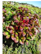
ウラシマツツジ: 日増しに色が...