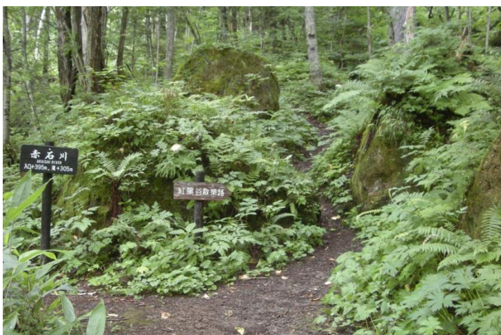
途中の散策路の様子