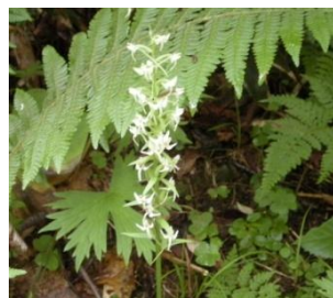
オオヤマサギソウ