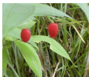
オオバタケシマラン