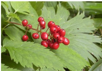
アカミノルイヨウショウマ