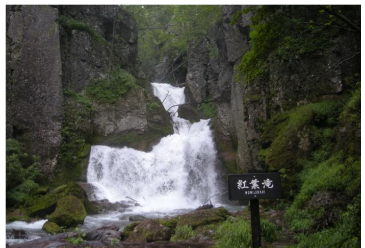
紅葉滝: 冷たい水の飛沫が満ちています