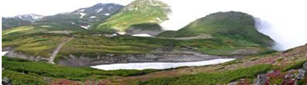
ポン黒岳からお鉢平方面～凌雲岳裾野部をはじめとしてナナカマドが点在のレベルであるが色付き始めてきた。

【七合目～頂上】 コモチミミコウモリ↓、ミヤマアキノキリンソウ、ヤマハハコ、ダイセツトリカブト、ウメバチソウ、チシマノキンバイソウ↓、チシマヒョウタンボク実、ナガバキタアザミ↓、ミヤマサワアザミ↓、イワギキョウ 【七合目～雲の平 ナナカマド】 全体を通して「やや色付いて」きたが、石室・雲の平周辺と九合目は「色付き始め」。