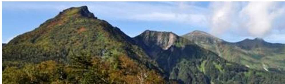
黒岳五合目展望台から～黒岳・桂月岳・凌雲岳・上川岳(左から)

【七合目】色付き始めも全体的に拡がってきた。【八合目】部分的に濃い色付きのものも目立ってきた。【九合目】全体的に見頃期に入ってきた。但し、下部はまだ色が増すと思われる。【頂上】全体的に見頃期に入ってきた。烏帽子岳方面はまだ色が増すと思われる。【石室～雲の平】全体的に見頃。但し、枯れかけ・緑葉・色付途中とバラツキあり。