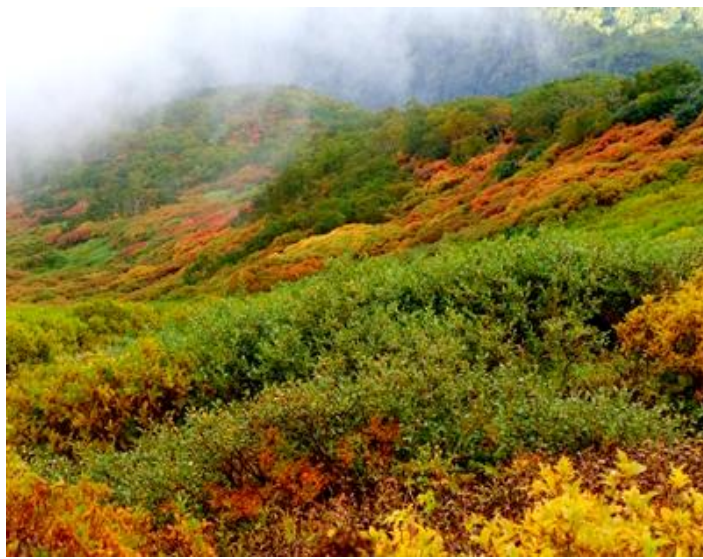
③ 黒岳九合目周辺下部谷間

①遠めに見るウラジロナナカマドが濃い色付きとなってきた。②③見頃期に入ってきた。特に、まねき岩付近は深い赤が出始めてきた。下部については、まだまだ色が増してくると思われる。黒岳東斜面全体が紅葉・黄葉に覆われる日もあとわずかとなってきた。