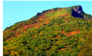
黒岳五合目展望台から〜黒岳・桂月岳・凌雲岳・上川岳(左から) 黒岳東斜面全体が彩られてきました

【紅葉情報】 現在、黒岳の紅葉は七合目までおりにきています。また、七合から五合目間も部分的に色付きが進んできています。上記の写真は、五合目展望台からのものですが、黒岳東斜面全体が彩られている感じがです。九合目のまねき岩付近は、やや色が落ちてきていますが、全体的にはまだ見頃です。石室周辺のナナカマドも枯れかけがはじめていますが、こちらも全体的には見頃です。雲の平では、やはり前回同様に「ばらつき」があります。枯れかけ・紅葉・色付き途中・既に見頃のもの・・・。但し、黒岳から北鎮岳間全般的には「今が見頃」といってもよいでしょう。