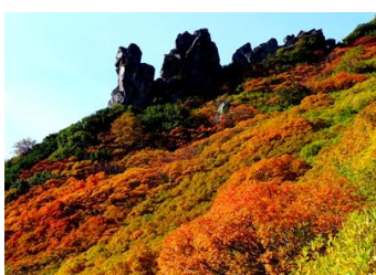
黒岳九合目まねき岩