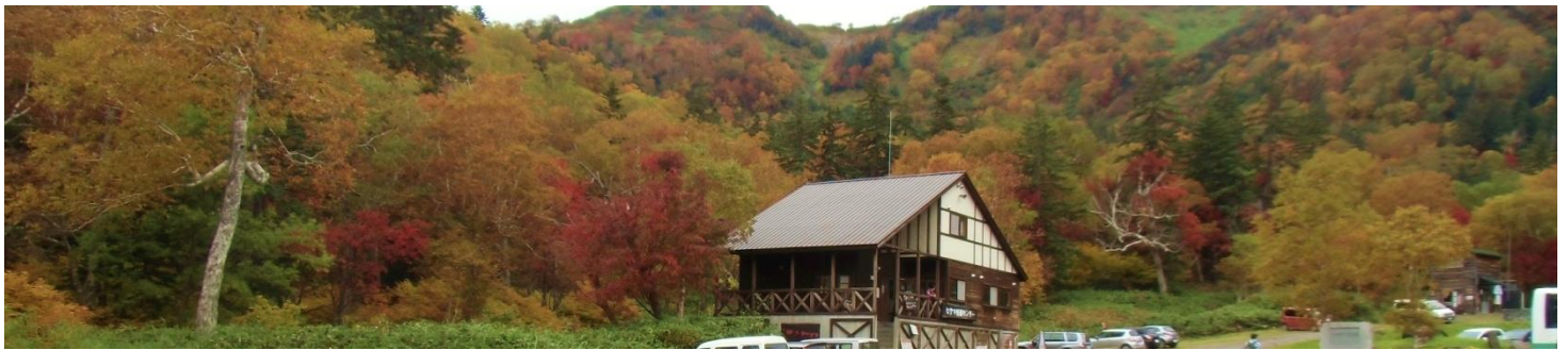
高原温泉のヒグマ情報センター↓

9月27～29日の強い冷え込みによりウコンウツギは痛んでしまいましたが、ナナカマドの赤がぐっと進み趣のあるコースとなりました。沼巡りコースの最終日は10月9日予定です。