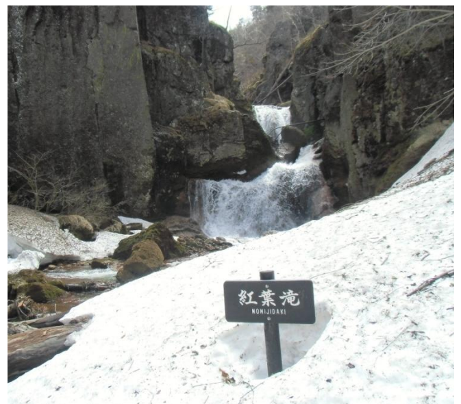
紅葉滝：手前には吹きだまった雪がたくさん残っていました