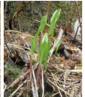
ギョウジャニンニク