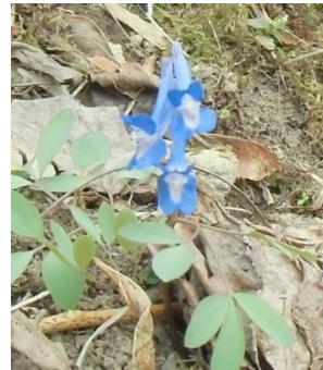
エゾエンゴサクが一株