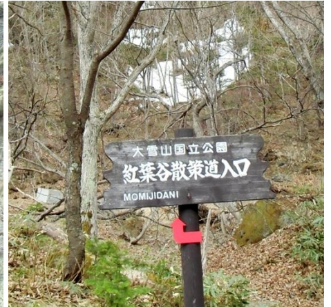
入口の看板付近に雪はありません