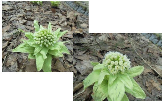
フキノトウの雌花 (上)・雄花 (下)