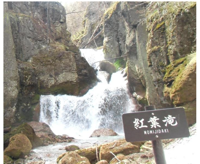
紅葉滝：雪解け水で豪快に流れています。