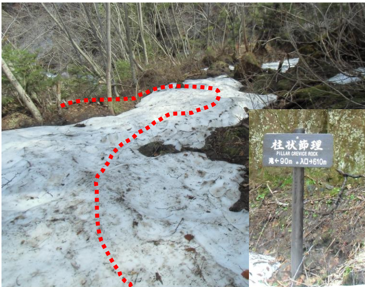
柱状節理の看板手前の残雪はやや急です。