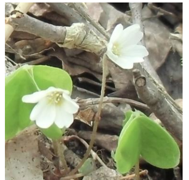
コミヤマカタバミ