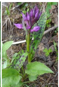
ウズラババクサンチドリ