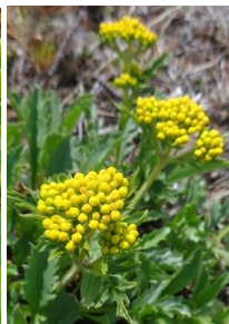
チシマキンレイカ