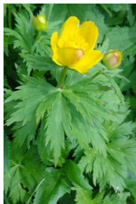
チシマキンバイソウ