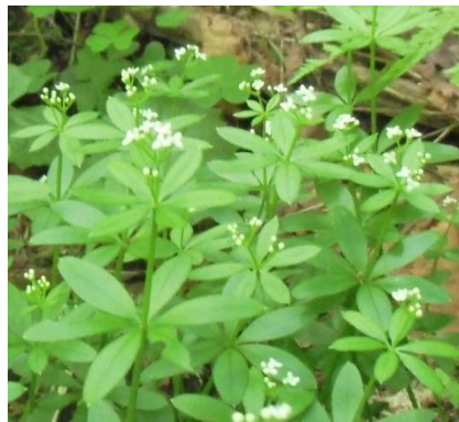
オククルマムグラ