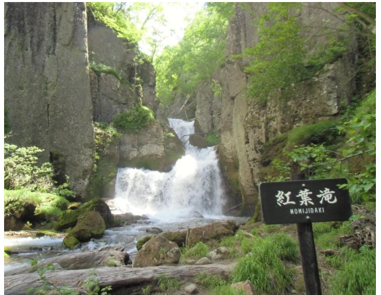
紅葉滝: 雪解け水を集めた流れは豪快です