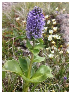
ホソバウルップソウ