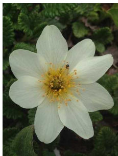
チョウノスケソウ