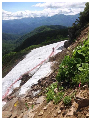
③エイコの沢ガレ場付近