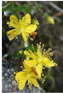
ダイセツヒナオトギリ