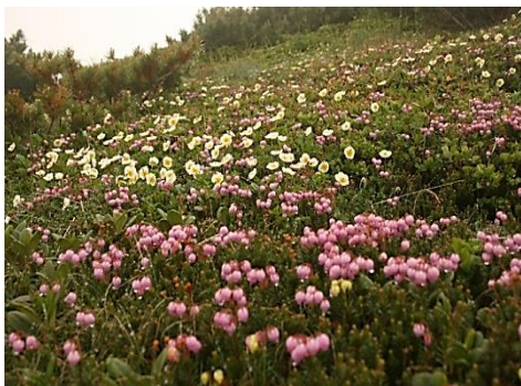
④白雲岳避難小屋周辺

雪溪の状況 ①第一花畑付近約90m ②第二花畑付近約100m ③ガレ場手前約90m、200m 第一、第二花畑とも木道がほとんど出てきましたが、この辺りの花の開花は天候にもよりますが、後10日はかかりそうです。 *雪溪の距離は概算です。