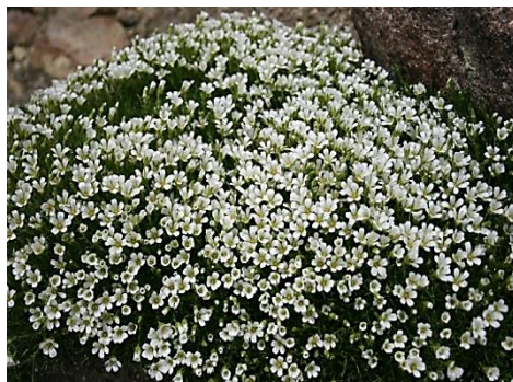
④白雲岳避難小屋周辺