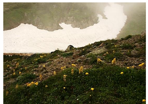
④白雲岳避難小屋周辺

④白雲岳避難小屋周辺では、エゾノツガザクラ・チングルマ・エゾタカネツメクサなどが群落を形成してきています。特に、小屋周辺ではキバナシオガマが見頃を迎えています。尚、板垣新道分岐から白雲岳避難小屋までは全面雪ですが、雪溪には迷い防止のロープが張られています。ヒグマの痕跡(糞)があります。鳴り物、ホイッスルなどは必須です。