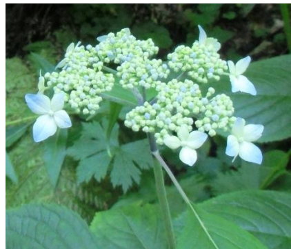
散策路を縁取るエゾアジサイ