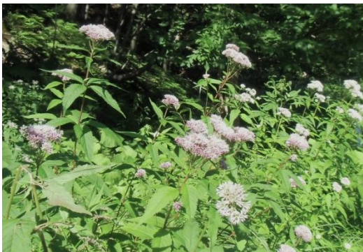
一面に咲くヨツバヒヨドリ