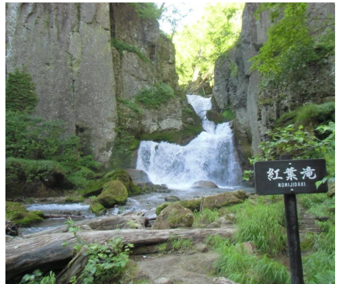
紅葉滝：水量が多く豪快