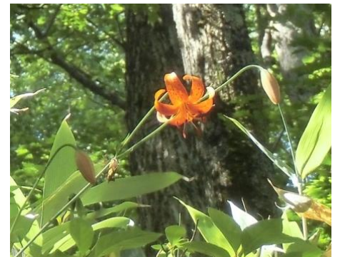
大きな岩の上に咲くクルマユリ