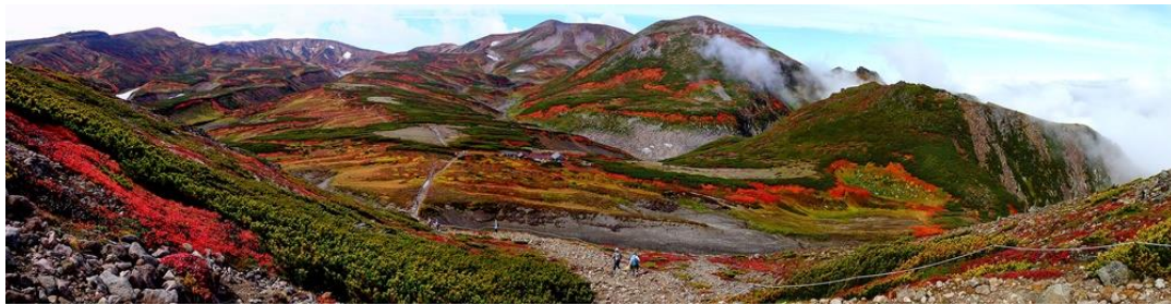
ポン黒岳から黒岳石室方面: 山全体が色付いています

【紅葉進捗状態】現在黒岳五合目まで色付き進む。北嶺岳に至るまで見頃期に入る。北海岳方面も見頃期。但し、ここに来てやや色落ちも目立ってきた。「七合目ウラジロナナカマド」見頃。枯れかけも。「八合目ウラジロナナカマド」見頃。枯れかけも。「九合目～頂上ウラジロナナカマド」見頃であるが、まねき岩周りや沢筋はやや色が落ちてきた。「石室～雲ノ平ウラジロナナカマド」石室周辺や雲ノ平周辺ではやや枯れかけも出始めるが見頃が続いている。全体的に草紅葉見頃。