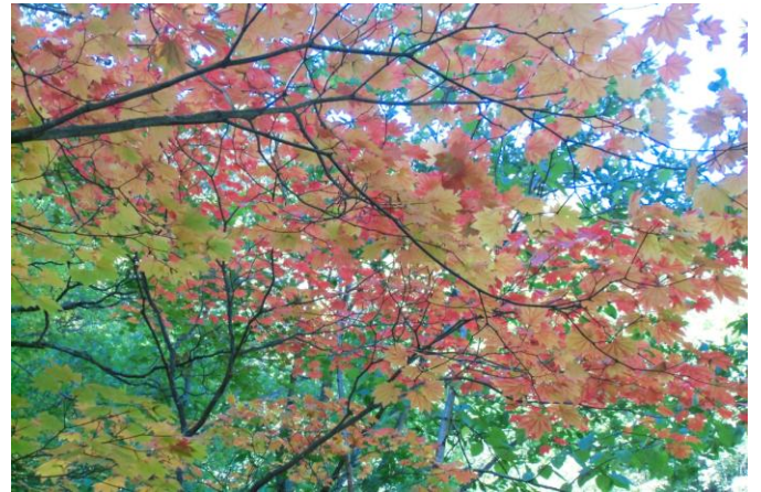
イタヤカエデ (黄色)・ハウチワカエデ (赤色)